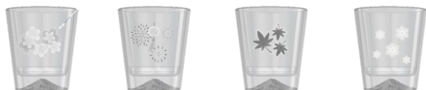
日本の四季をイメージにしたショットグラス サンプル